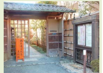
鎌倉市鍋木清方記念美術館