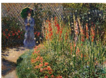
《グラジオラス》クロード・モネ c.1876年 City of Detroit Purchase