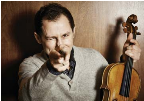
アントワン・タメスティ (ヴァイオリン)

30・40代中心の、今後の音楽界を担う演奏家たちが一同に会す、一夜限りの豪華なコンサート。みなとみらい初登場となる、フランスのヴァイオリニスト、アントワン・タメスティは、2004年ARDミュンヘン国際コンクールで優勝し、ヴァイオリン界の歴史を塗り替えたスーパースターです。指揮・オルガン・チェンバロは世界