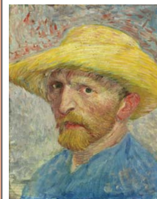
《自画像》フィンセント・ファン・ゴッホ 1887年 City of Detroit Purchase