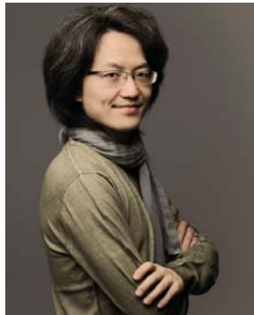
鈴木優人 (指揮・オルガン)