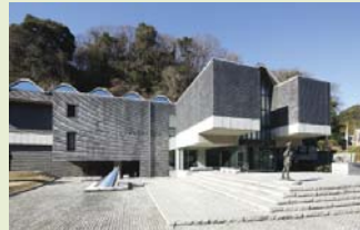
神奈川県立近代美術館 鎌倉別館

鎌倉市川喜多映画記念館、神奈川県立近代美術館 鎌倉別館、鎌倉国宝館、鎌倉市鍋木清方記念美術館の4館の学芸員が、各施設や建築、鎌倉とのゆかりについて紹介し、鎌倉の歴史と共に歩んできたアートについて座談会を行います。ご希望により旧川喜多邸別邸(旧和辻邸)もご見学いただけます。