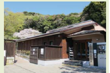
鎌倉市川喜多映画記念館

〒248-0005 鎌倉市雪ノ下2-2-12 鎌倉市川喜多映画記念館「4館イベント」係