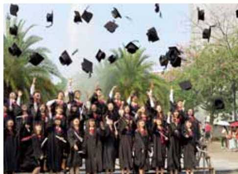
卒業記念写真後、帽子を放り上げる学生

この学生は日本のアニメやドラマが好きで、小さい頃からテレビで見ていたそうです。「中国にもいろんなドラマがあるでしょうに、どうして日本のドラマがおもしろいの？」と聞くと、「中国のはワンパターンでおもしろくない。中日戦争のドラマや三角関係の恋愛ドラマで結末がすぐ分かってしまう。日本のドラマは新鮮で勇気とか正義、友情、夢など作品に主張がある。」と言います。こういう学生でも「大学で日本語を勉強したい」という話しをした時、両親に猛反対されたそうです。いま、日中関係が険悪な状態になり、日本語を生かせる就職先が少なくなり、「そら、日本語なんか勉強するから、大学卒業しても仕事が見つからないんだ」と言う圧力の下で、必死に頑張っている様子を想像するだけでも胸が痛みます。何とか、彼らの努力が生かされて、夢がかんうことを願わずにいられません。