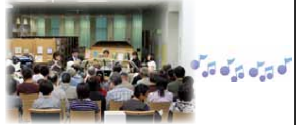
前回のコンサートの様子

秋も深まり、音楽を楽しむのにとてもよい季節になりました。みなさんがいつも利用している図書館で、閉館後に『木管アンサンブル木音（このん）』による木管五重奏のコンサートを行います。入場無料、事前の申込みもありません。ご家族で、お友達と、ぜひお気軽にお立ち寄りください。